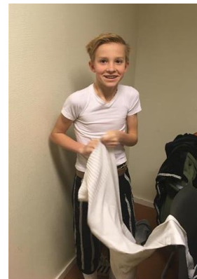
De prinsenkleding mag aan ...